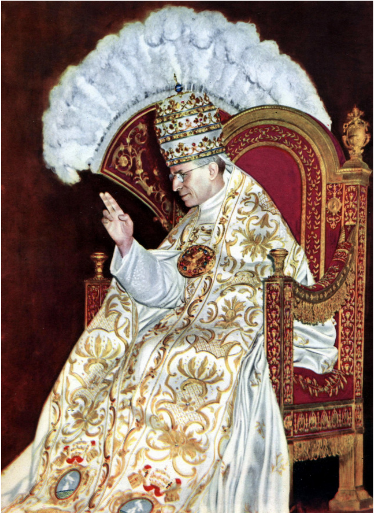
A PÁPAI TRÓNON ÜLŐ XII. PIUS PÁPA FEJÉN A TIARÁVAL