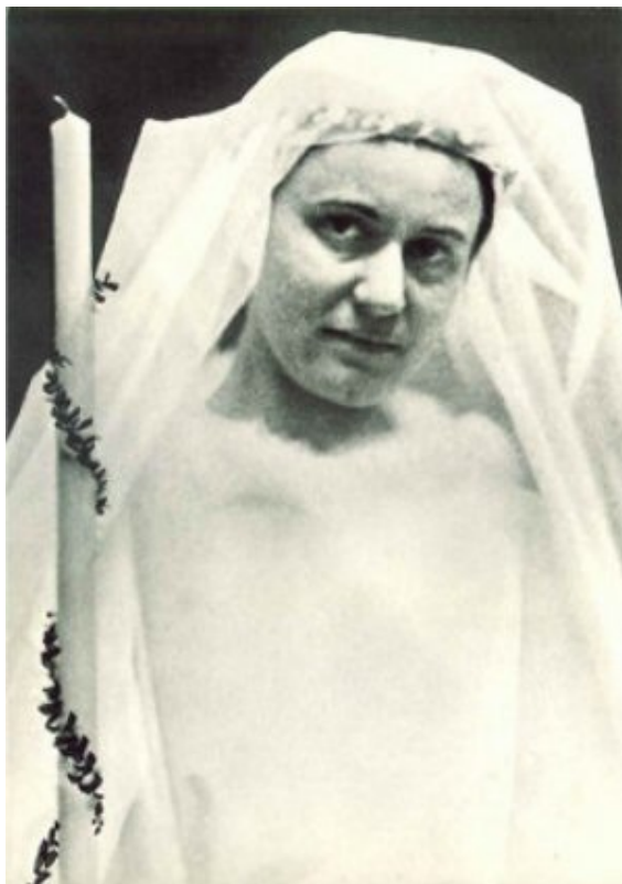
EDITH STEIN, azaz SZENT TERÉZIA BENEDIKTA