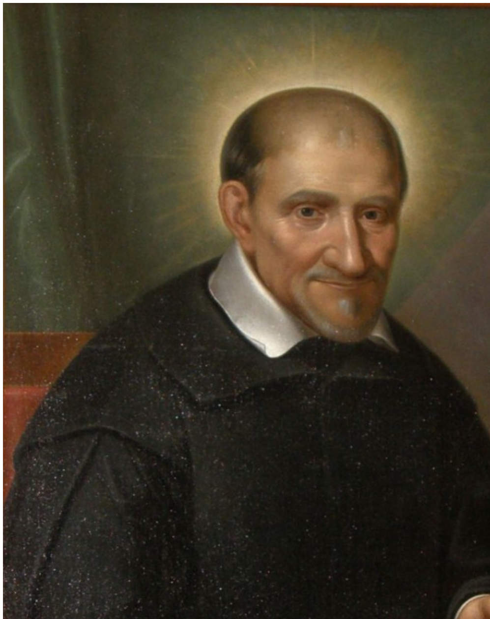
SAINT VINCENT DE PAUL - PÁLI SZENT VINCE (1581-1660)

Dél-franciaországi szegény földműves szülők tehetséges fia, aki előbb Dax-ban a ferenceseknél, majd Toulouse (tulúz) és a spanyolországi Zaragoza egyetemén tanult. 1600 szeptemberében, 19 évesen szentelték pappá. Egy hajóúton török kalózok fogágába esett, akik Tuniszban eladták rabszolgának. Egy aposztatált ferences váltotta ki, akit Vince visszatért a katolikus hitre, és együtt jöttek haza Franciaországba. Ott 1610-ben IV. Henrik és első neje, Valois Margit házi káplánja lett. Egy évig a Párizs melletti Clichy (klisi)-ben plébános. Lelkiatyja Pierre de Bérulle (pier dö bérüll) kérésére nevelő lett Philippe-Emmanuel de (filip-emanüel dö) Gondi gróf családjában. 1617-től a lyoni főegyházmegyében lévő Chatillon-les-Dombes (satijon lé domb) plébánosa. 1625-ben Párizsban megalapítja a népoktatásra és – missziókra szánt lazarista férfirendet, majd Marillac (marijak) Szent Lujzával a Szeretet Leányaiét 1643-ban. Az irgalmasnővérek betegápolók és tanítók voltak. 1729-ben boldoggá, 1737-ben szentté avatták, 1885-től a karitászegyletek védnöke.