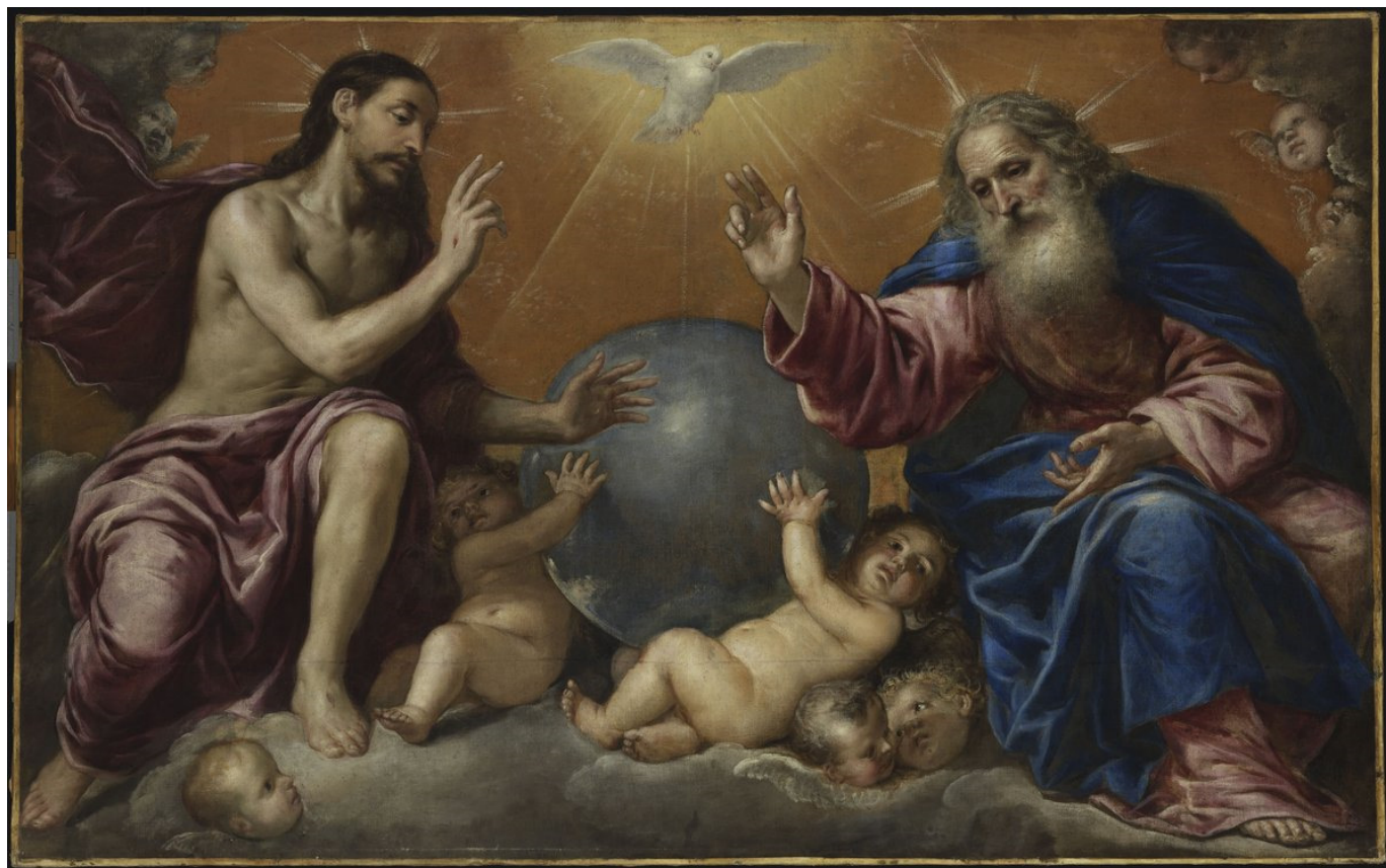
Antonio de Pederia (1659 körül): A Szentháromság

Sándor pápa (+1181) is hasonlóképpen nyilatkozott. Ennek dacára az ünnep egyre jobban elterjedt, végül XXII. János pápa avignon (avinyon)-i fogsága idején 1334-ben az egész egyházra nézve bevezette. Az üdvösségtörténeti eseményekhez nem kapcsolódó legkorábbi ünnep azért került a pünkösdöt követő vasárnapra, hogy az üdvösség megvalósult misztériumára hálásan tekintsenek, mert ez a korai teológia szerint az Atya a Fiú által a Szentlélekben hajtja végre