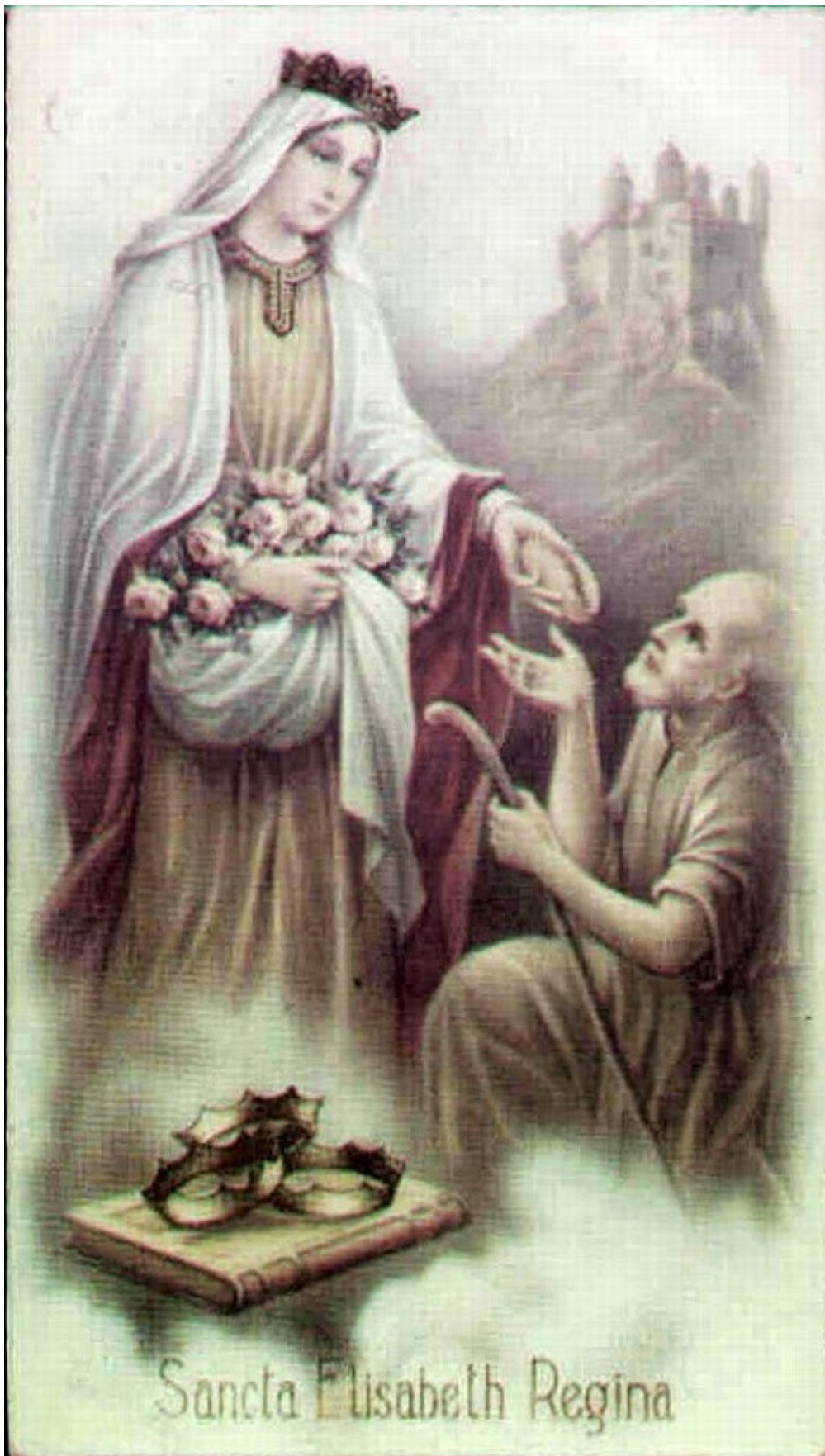
ÁRPÁD-HÁZI SZENT ERZSÉBET (1207-31)

II. Endre és Meráni Gertrúd szentéletű lánya német földön lett a szolgáló szeretet példaképe. Halála után 4 évvel már édesapja is a szentek sorában köszönthette. A világegyházban kötelező emléknapja november 17, nálunk 19., a temetés napja